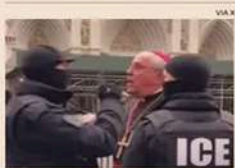
Minneapolis. Monsignor Bernard A. Hebda protesta contro agenti dell'Ice